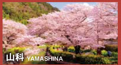
山科 YAMASHINA 京の東の玄関口山科。観光名所も多く、京焼・清水焼の窯元も集積し大陶器市には目利きで賑わいます。