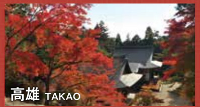
高雄 TAKAO 燃えるような紅葉が続く山里の風景は一見の価値有り。京都リピーターの中でも人気が高いエリアです。