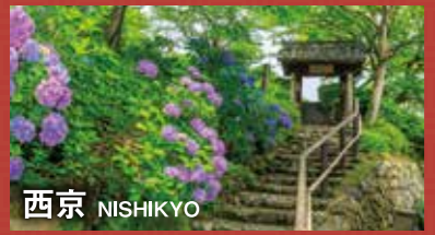
西京 NISHIKYO 松尾・桂・洛西の3つの地域があり、自然豊かな風土だけでなく、歴史的な寺院神社が多いことでも有名です。