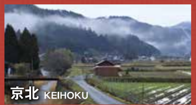
京北 KEIHOKU 周囲を山々に囲まれ、豊かな自然に恵まれた地域。地元で獲れる京野菜や上桂川の鮎は絶品です。

東山、祇園、嵐山…。京都市には世界的に有名なたくさんの観光名所があります。でも、まだまだ知られていないスポットがたくさんあることをみなさんご存知ですか？伏見、大原、高雄、山科、西京、そして京北。このような市内周辺のエリアにスポットをあて、ガイドブックには載っていないような知る人ぞ知る隠れた魅力や新たな観光情報、地域のイベントなど、「とっておき」の情報をお届けします。