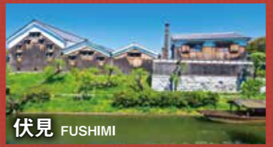
伏見 FUSHIMI 幕末の動乱時、歴史の舞台となった伏見。日本三大酒地のひとつで、伏見の女酒としても有名です。