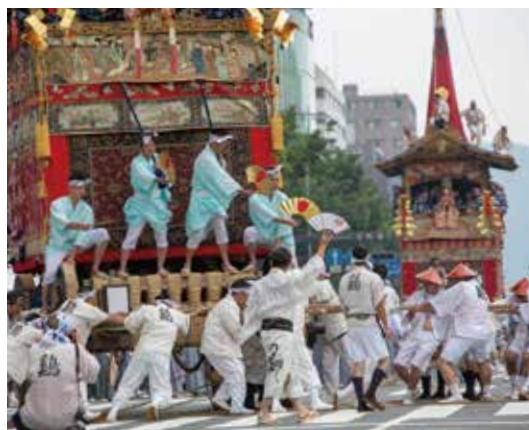
祇園祭 前祭山鉦巡行