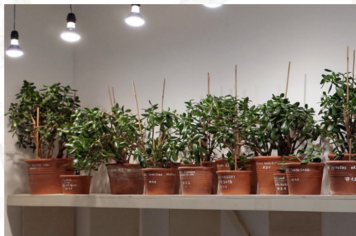
Jean-Louis Boissier « Crassula ubiquiste », Exposition Media Medium (2014)

「伝統と革新」を象徴する野心的空間・瑞雲庵において、世代・表現領域の異なる6人の日仏アーティストが、アートをつうじてエコロジーを問う。