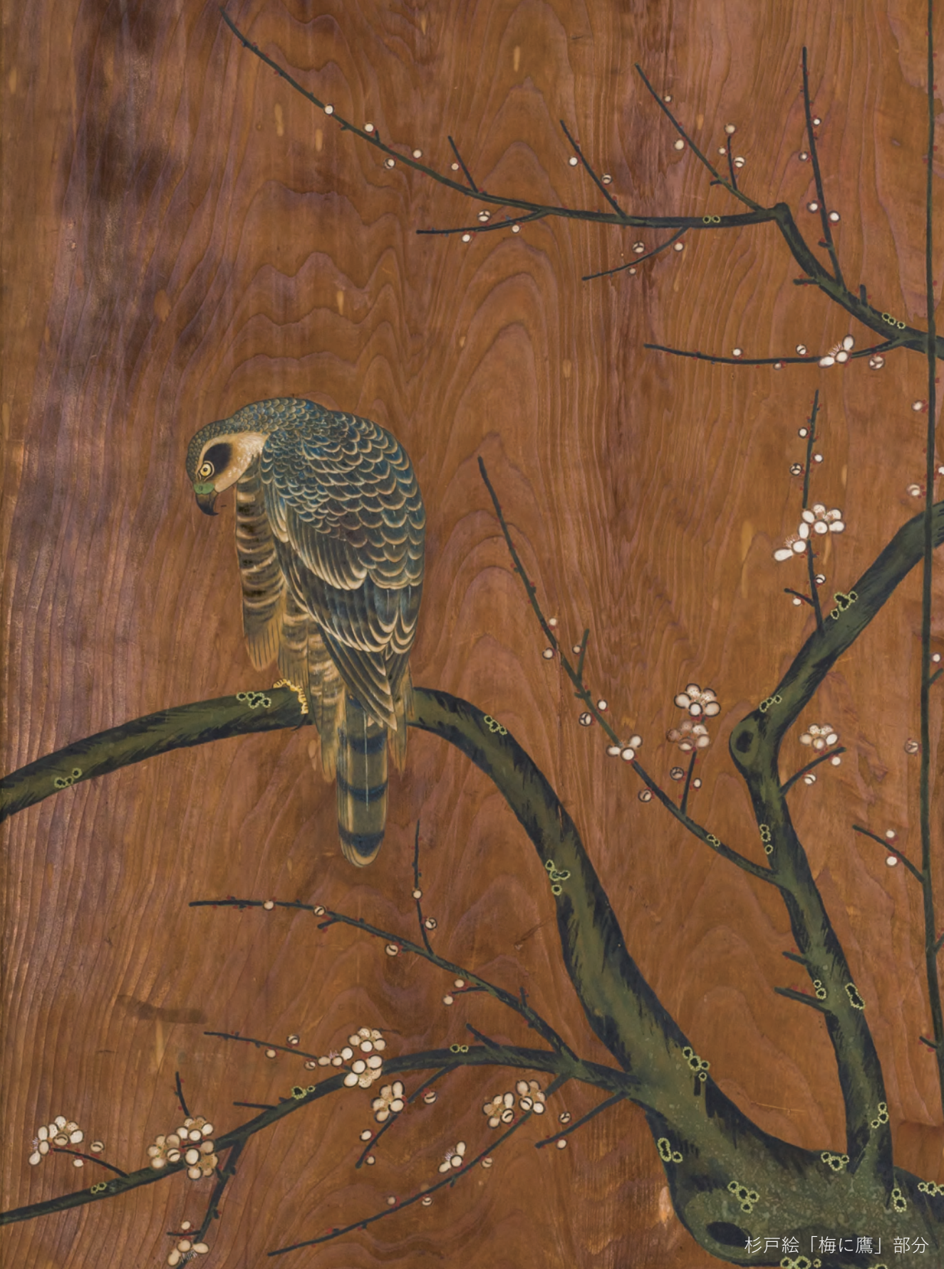
杉戸絵「梅に鷹」部分