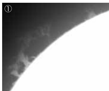
①太陽プロミネンス（2022年9月15日） 別館：18cm屈折ザートリウス望遠鏡。晴天時には、リアルタイムの太陽画像を観察できます。