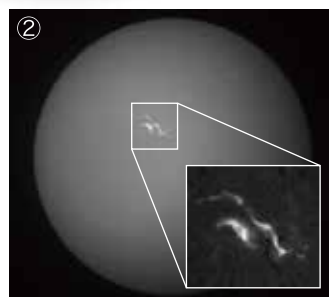
②中規模フレア（2021年11月2日） 別館：18cm屈折ザートリウス望遠鏡。晴天時には、リアルタイムの太陽画像を観察できます。