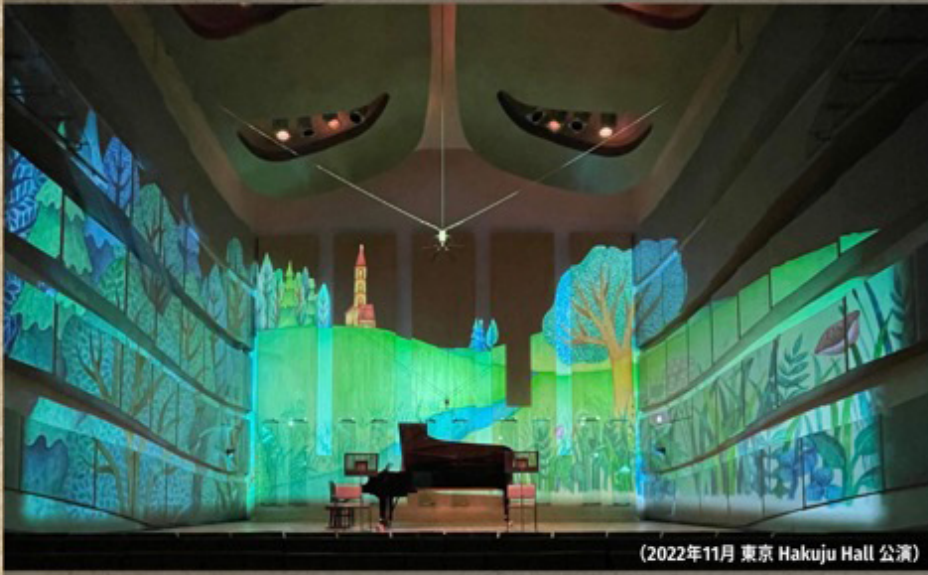
(2022年11月 東京 Hakuju Hall 公演)

ドイツの「マザーグース」と呼ばれるこの本は、人々の間で語り継がれてきた民謡集で、風景・動物・生活・神様・愛・戦争・死といった、人間と自然の普遍的な営みが描かれています。これらは「芸術と呼ぶより(生)である」と語ったグスタフ・マラー(1860-1904)の作曲の『角笛』の詩による歌曲から十六曲を選び、「昔あるところ」の人々・動物達のちよっとしたストーリーを作ってみまされた。プロジェクション・マッピングで投影される、まつむらまいこの絵本の世界と共に、演奏をお楽しみ下さい。