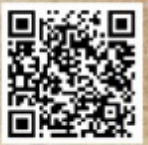
絵本仕立ての演奏会 クラファンサイト