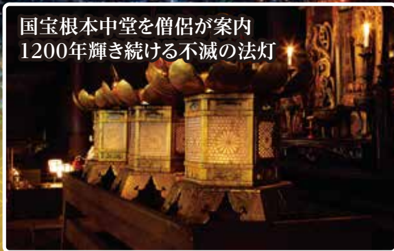
国宝根本中堂を僧侶が案内 1200年輝き続ける不滅の法灯