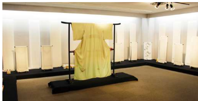
絹の白生地資料館 伊と幸ギャラリー