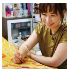
京都府・京もの認定工芸士 京都市・未来の名匠 （木村染匠株式会社所属）