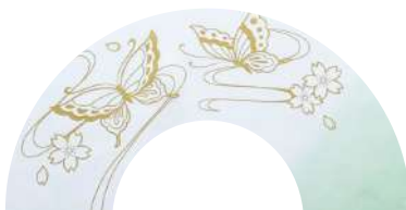
② 胡蝶 × 白緑