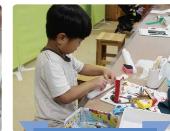
ゴミラプロジェクト