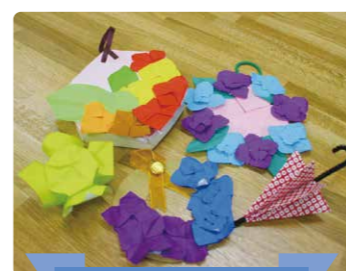
アジサイの折り紙リース