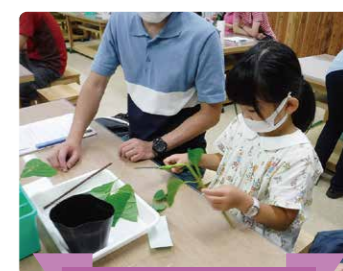
アジサイの挿し木