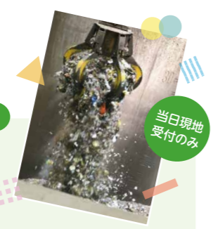
当日現地受付のみ