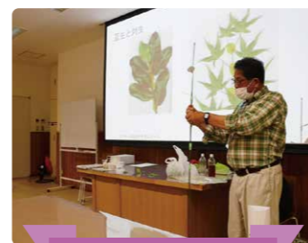
アジサイってどんな花?