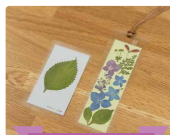
アジサイ押し花しおり