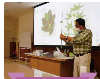
アジサイってどんな花?