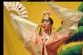
謡曲仕舞奉納家一扇 「みろく涼香舞(すずかまい)」