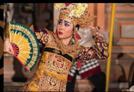
アルジュナ・スリカンディ