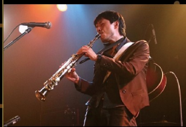
～世界を旅する弾き語りサクソ奏者～ マサトシドラムス