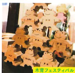
木育フェスティバル