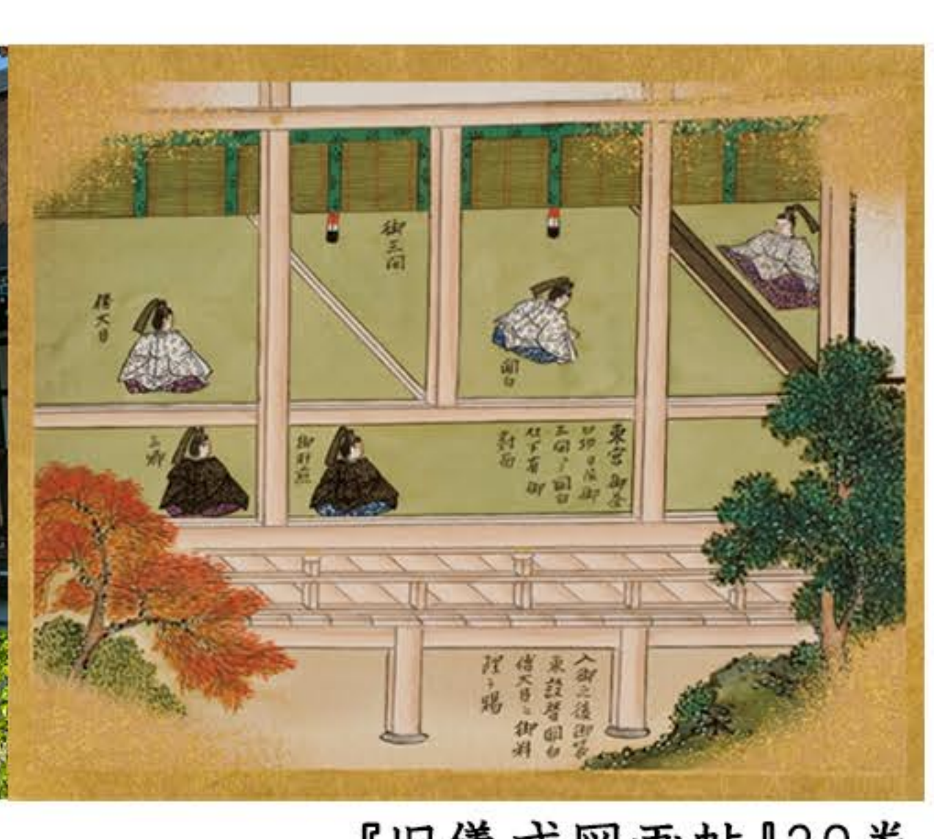
御三間 『旧儀式図画帖』39巻 「十月(不日定)新茶御壺口切之儀」 東京国立博物館所蔵

京都御所では、旧暦10月に、新茶を入れた茶壺の封を切る口切の儀式が行われました。御所における口切の儀式とは、料理や酒とともに新茶や菓子が振舞われるもので、江戸時代に宮中儀式として確立され、幕末まで行われました。今回の再現展示は、御三間で行われた東宮新茶御壺口切之儀をテーマに、絵図に画かれた御対面の様子を人形などを用いて再現します。