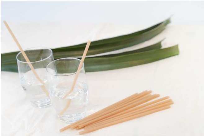
パイナップル繊維ストロー

・沖縄県を拠点に農業と化学の両面から持続可能な生活様式形成を目指す株式会社フードリボン様より、パイナップルの繊維を作り出す際に生まれる残渣を再利用したバイオプラスチックストローをご提供いただきます。