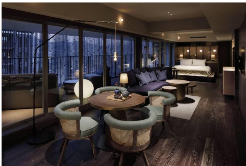
「GOOD NATURE HOTEL KYOTO 스위트룸1泊2日2食付きペア宿泊券」 (京阪ホールディングス株式会社様ご提供)