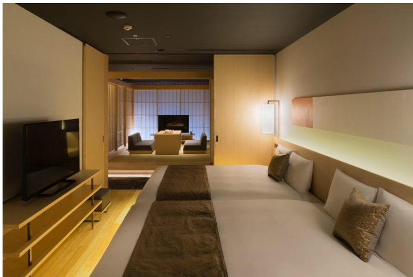
「hotel kanra kyotoスイートルーム1泊2日2食付きペア宿泊券」 (UDS株式会社様ご提供)