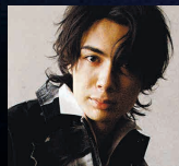
LEO ©NIPPON COLUMBIA