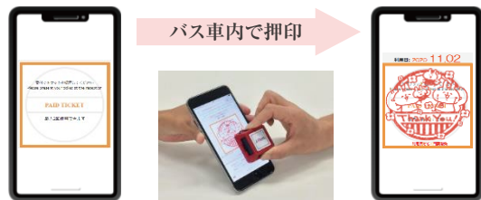
※画像はイメージです。実際のチケット画面とは多少異なります。