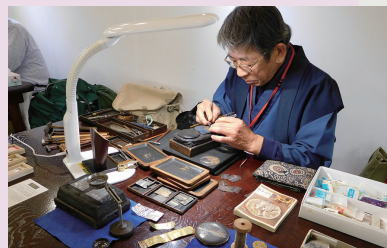
伝統産業約40品目の実演及び約10品目の体験