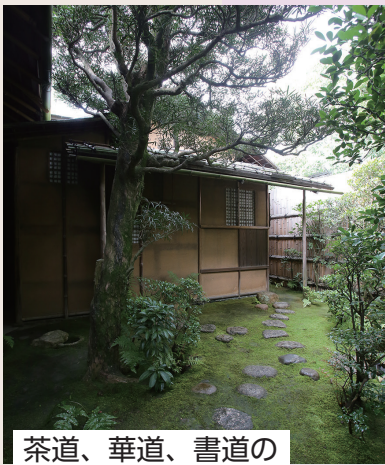
茶道、華道、書道の 実演、体験、展示