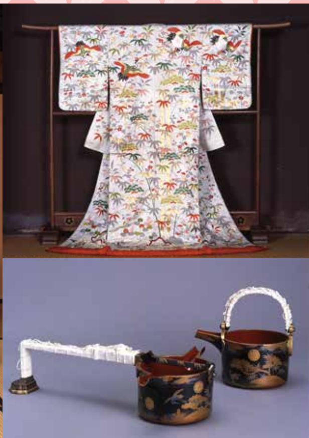
展示イメージ(総手縫い刺繍による豪華な婚礼衣装と道具) ※当日の展示とは異なります