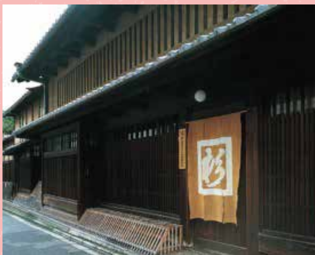
伝統的な暮らしの文化が息づく杉本家住宅(明治3年築)