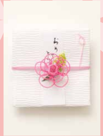
お作りいただく水引細工(イメージ)