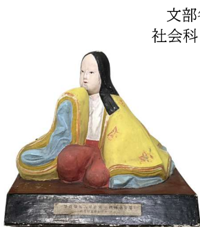
風俗人形(平安時代) 年代不詳

文部省著作教科書『中学三年生用 社会科13 文化遺産』(勝田守一執筆) 昭和24(1949)年