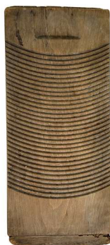
洗濯板 格致校 年代不詳