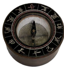
方位磁針 稚松校 年代不詳

みなさんの通った学校に、「郷土資料室」などと名付けられた、昔の生活道具や美術工芸品などが集められている部屋がありませんでしたか？ 実を言うとこの部屋、近年「学校博物館」として見直しが進められていて、しかもかつては、日本全体の博物館のうちのなんと約4割を占めた、歴史的にもとても重要な施設でした。また、時代が令和へと移り変わった現在でも、全国や世界には大変ユニークな学校博物館が多数存在していて、この場所で地域の人たちが児童と交流するなど、地域と学校の絆を深める大切な空間になっっている学校博物館もあるのです。 そんな注目すべき学校博物館の歴史や現状、そしてその奥深き魅力の数々を紹介するのが、本企画展「奥深き「学校博物館」の世界」です。