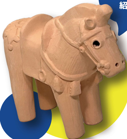
馬形埴輪模型 桃園校 年代不詳