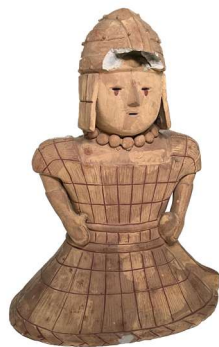
兵士埴輪模型 桃園校 年代不詳