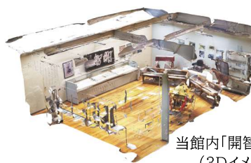
当館内「開智資料室」 (3Dイメージ)