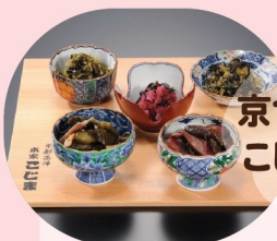
京つけもの本家 こじま西陣本店

明治44年創業の京つけもの専門店。西陣で受け継ぐ発酵文化と伝統製法で、季節野菜の旨味を引き出した老舗の味をぜひご賞味ください。