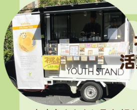
北青少年 活動センター

京丹後・丹波で作られる新羽二重もち米を使った創作餅スイーツ。多彩なメニューから、新しい餅の魅力を発見しよう。