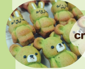
crème x plus

本格イタリアンの技で仕上げた台湾グルメが登場!やさしい味わいで子どもから大人まで楽しめる、ここだけの特別メニューをお届けします。