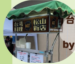
台湾料理MRT 松山新店 byながぐつ食堂

緻密で正確な味わいを追求した「インダストリアルジン」。「Yummy(美味しい)」と「Arrest(逮捕)」を組み合わせた「yumarrest(ヤマレスト)」をご賞味あれ。