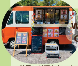
World Kitchen Car T's Table

青少年とともに取り組むYOUTH STANDが出店。美味しいメニューと交流を楽しめるキッチンカーが魅力!