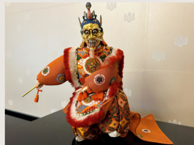
蘭陵王（桐塑人形） 林 駒夫