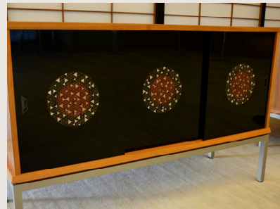
山紫水明（飾り台） 北村 昭斎 監修、北村 繁 作