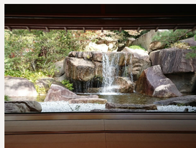
滝の間（通常非公開）