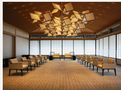
水明の間（通常非公開）