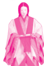
女性装束 「玉鬘」歳暮の衣配の場面 京都宮廷文化研究所蔵