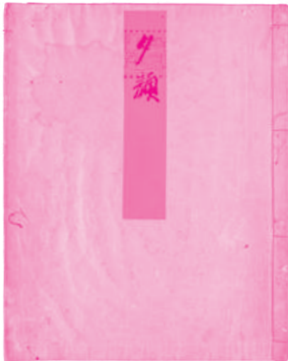
『源氏物語』五十四帖「夕顔」 大覚寺所蔵