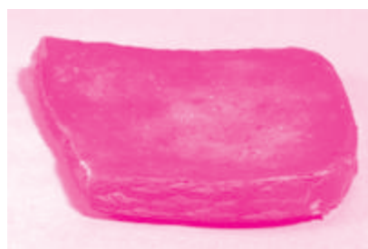
「蒔絵硯」 京都市考古資料館所蔵