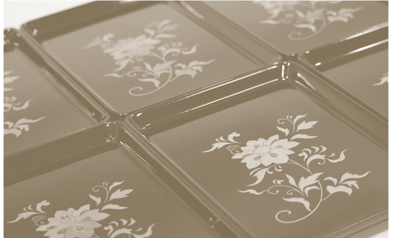
宝相華蒔絵七寸切手盆