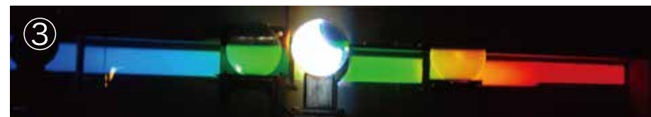
③太陽スペクトル（虹） 太陽館： 70cm シーロスタット望遠鏡