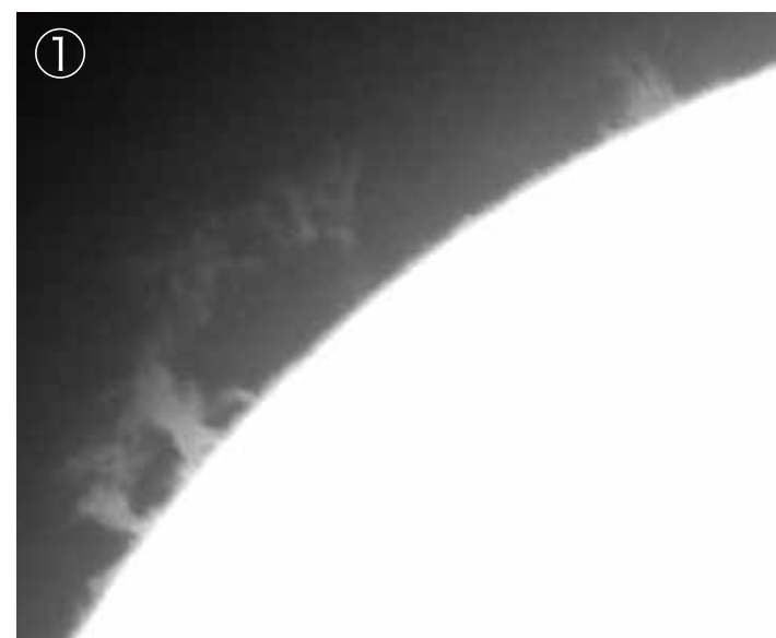
①太陽プロミネンス（2022年9月15日） 別館：18cm屈折ザートリウス望遠鏡。晴天時には、リアルタイムの太陽画像を観察できます。